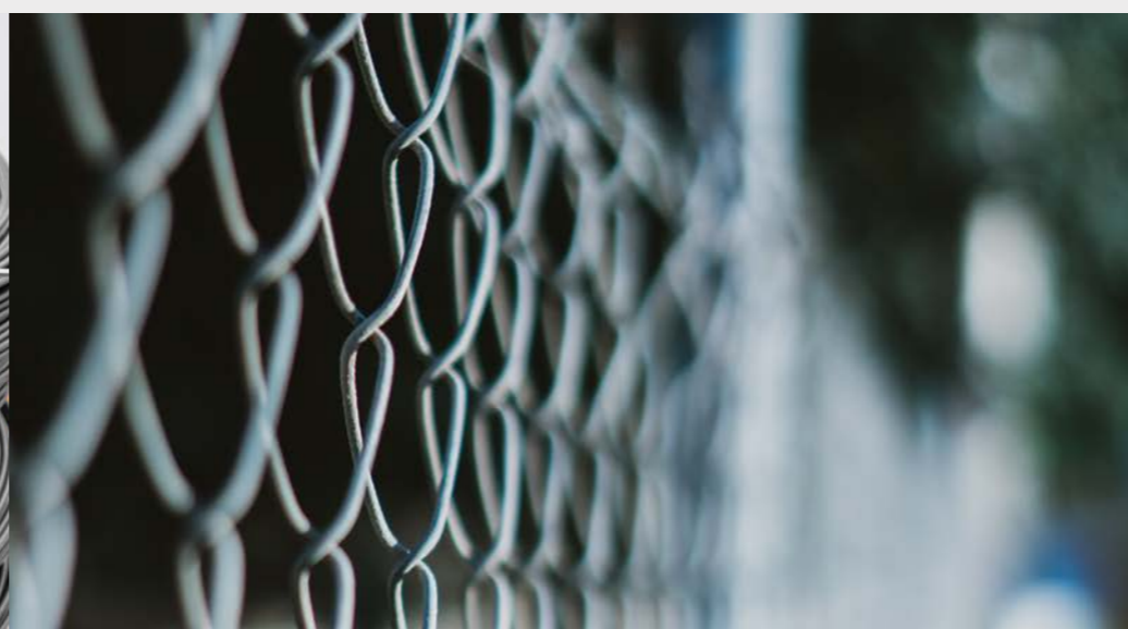
➔ Malla tejida