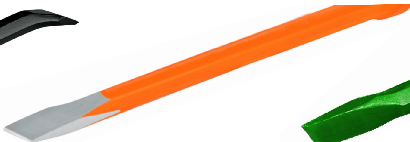
➔ Chuzo AZA